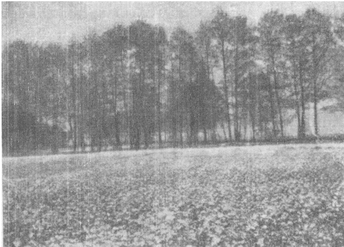
Massenhaftes Auftreten der Sandkresse ( Arabis arenosa Scop.) auf den trockenen Torfwiesen bei Sompolno.

Von Doldengewächsen wachsen in der Umgegend von Sompolno folgende bei Drymmer nicht aufgezählte Arten: Gem. Bärenklau ( Heracleum sibiricum L.), die starre Sesel ( Seseli annuum L.), Saat-Haftkraut ( Caucalis daucoides L.), gefleckter Schierling ( Conium maculatum L.), Laserkraut ( Laserpitium prutenicum L.), Berg-Sellerie ( Peucedanum oreoselinum L.), Brenndolde ( Cnidium venosum Hoffm.), Gemeiner Kümmel ( Carum carvi L.).