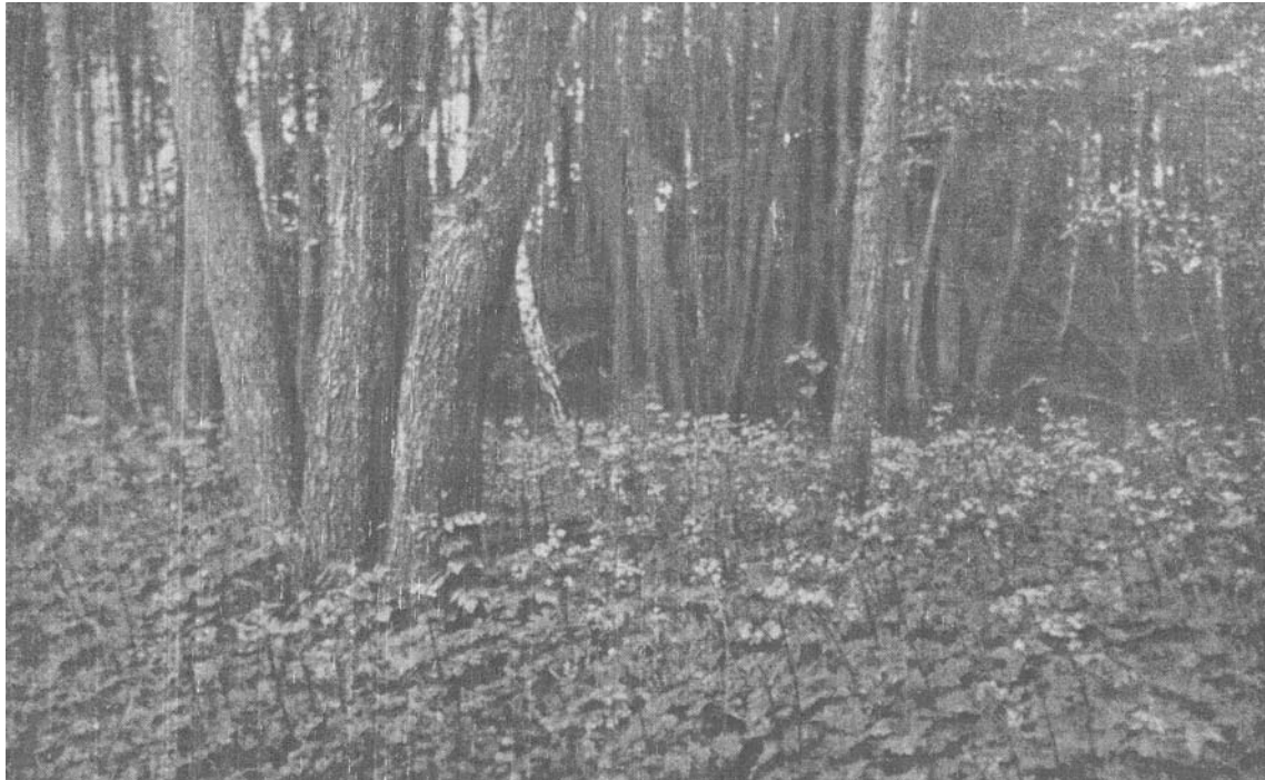
Reiche Bestände der Sterndolde ( Astrantia major L.) im Trollbruch.